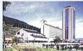
越後湯沢温泉 NASPAニューオータニ