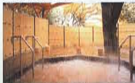
有馬温泉 ねぎや 陵楓閣