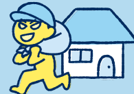
盗難 じょうなん ・騒擾