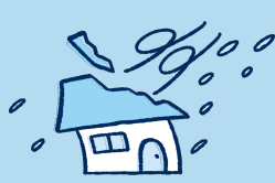
風災 ひょう ・雹災 ひょう ・雪災 ゆき *2