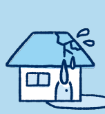
水濡れ みづぬれ *4