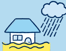
水災 みづ *3