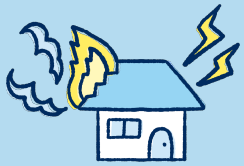
火災・落雷・破裂・爆発